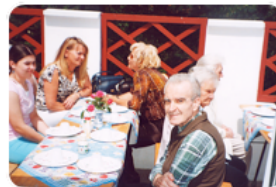
Sommerfest Haus Wildpark