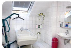
Dusche und Bad